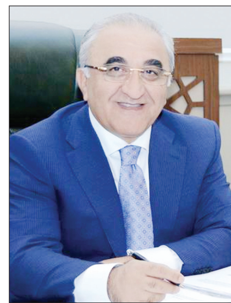
Ən böyük arzum anamı atamın yanında dəfn etməkdir